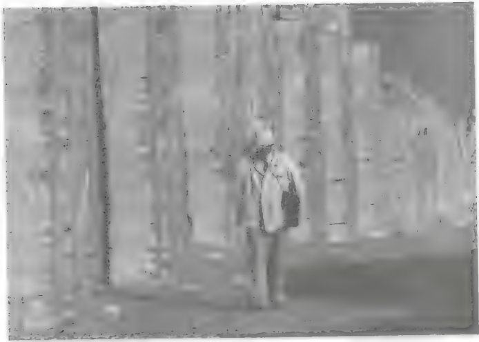
لوير يسير أمام السور من ناحية الجنوب